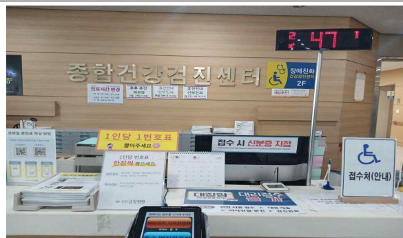
조은금강병원 장애인 검진 접수대