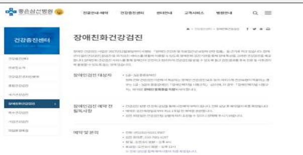
좋은삼선병원 장애인 검진 예약 홈페이지