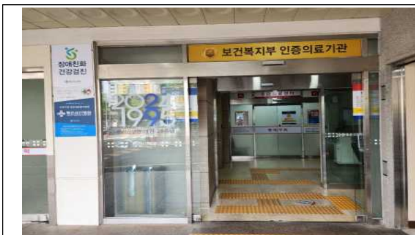
좋은삼선병원 검진센터 주출입구