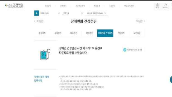
조은금강병원 장애인 검진 예약 홈페이지